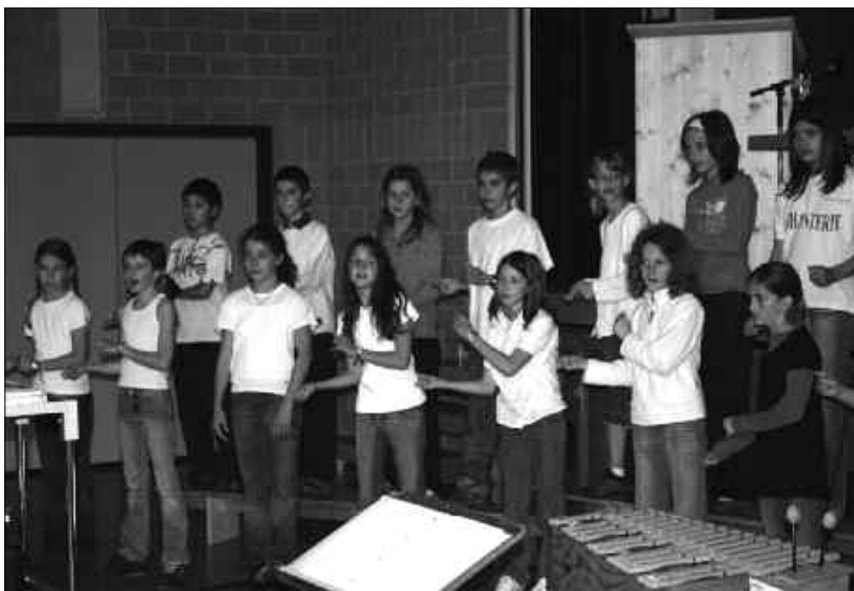
Chanterie de Bagnes